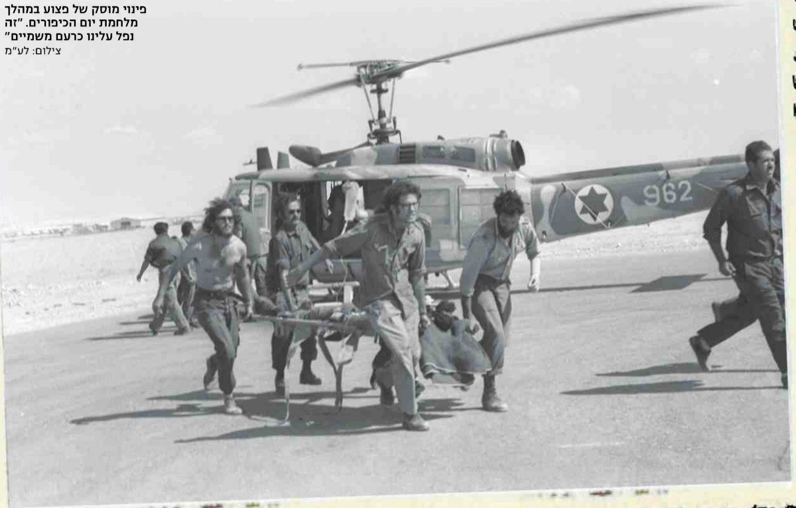
פינוי מוסק של פצוע במהלך מלחמת יום הכיפורים. "זה נפל עלינו כרעם משמיים"