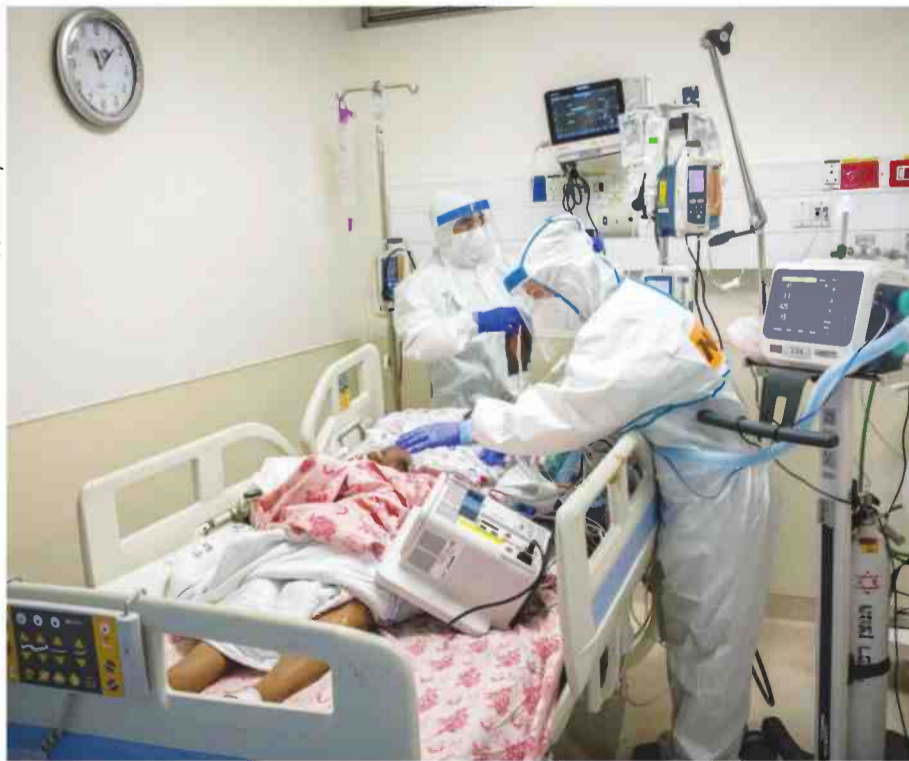
צוות רפואי מטפל בנפגע קורונה בבית החולים שערי צדק, בשבוע שעבר